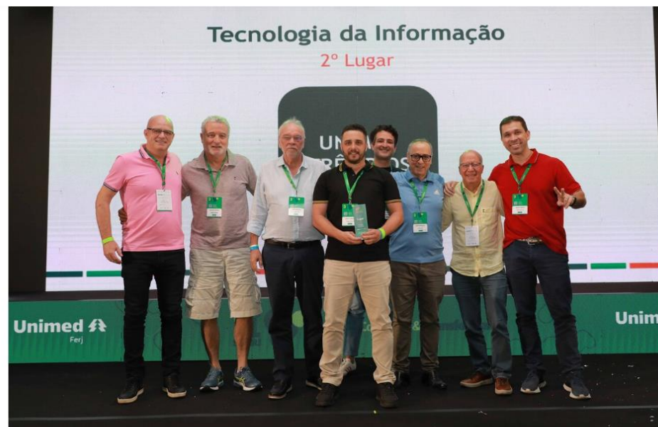
2º lugar: Unimed Três Rios

A Unimed Três Rios foi a 2ª colocada no Prêmio de Melhores Práticas na Área de Tecnologia da Informação. A premiação aconteceu durante a 31ª edição do SUERJ, o Simpósio das Unimed dos Estado do Rio de Janeiro. O prêmio envolve o resultado do trabalho de toda a cooperativa.