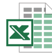
TB 038_Odontologia Versão 2019.02