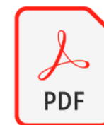
Instruções Gerais - Rol de Procedimentos Médicos Unimed - Versão 2019.02