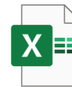
TB 039_SADT Versão 2019.02