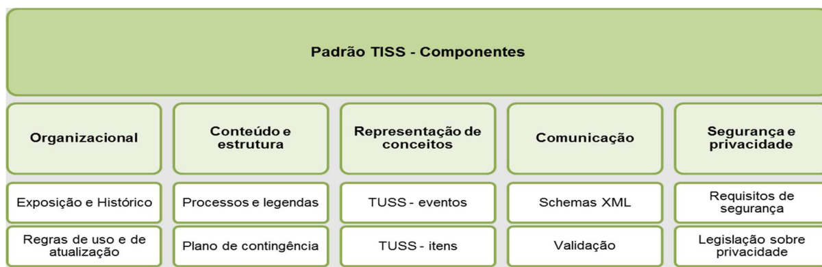
Figura 1 - Diagrama dos Componentes do Padrão TISS